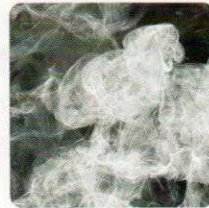
消除有害化学气体