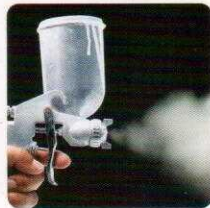
降解挥发性有机化合物 (VOCs) 和其他有机化合物