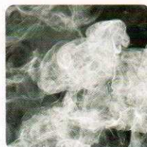
消除有害化学气体