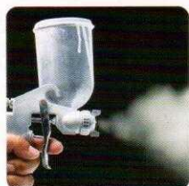
降解挥发性有机化合物 (VOCs) 和其他有机化合物